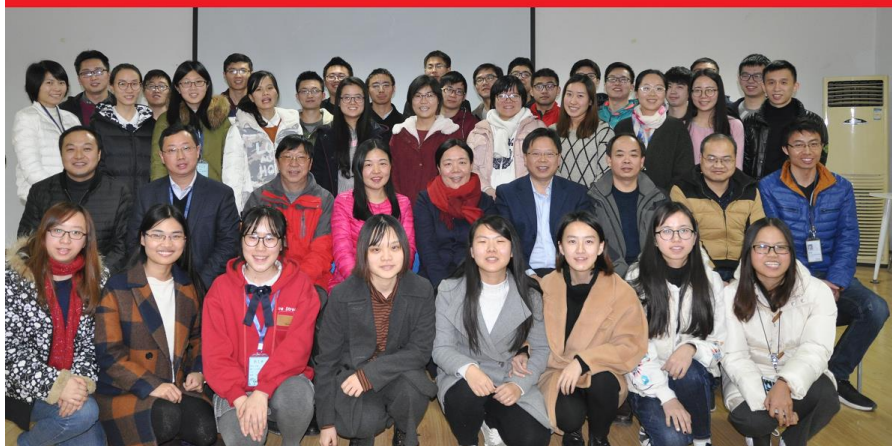
2017级第三期非全日制硕士研究生座谈会