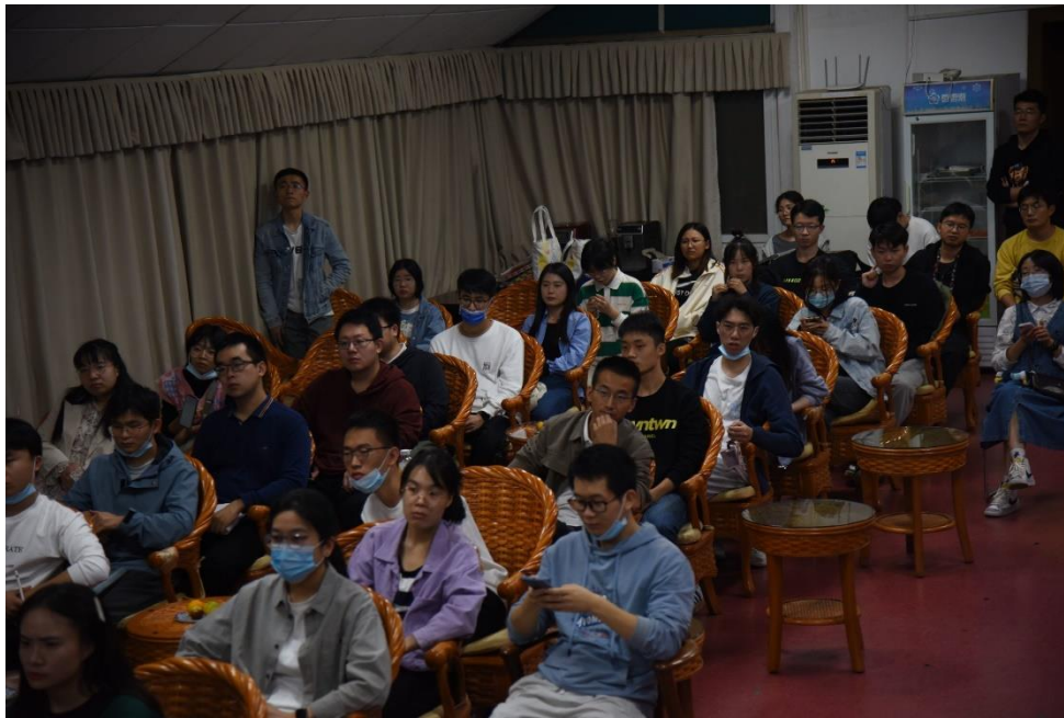
图3 观众认真听报告